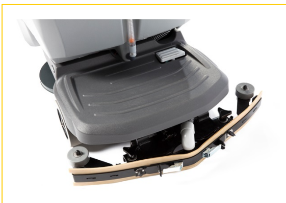
Solid stå bak plattform

BE NICE TO PEOPLE FLOORPUL ® INTERNATIONAL NV