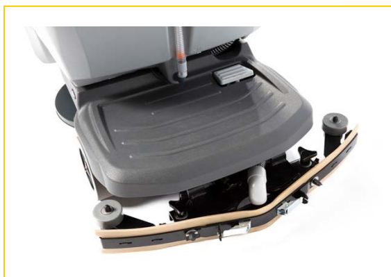
Solid stå bak plattform

BE NICE TO PEOPLE FLOORPUL ® INTERNATIONAL NV