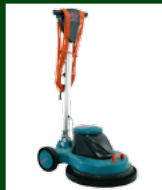
Orbis UHS 1500