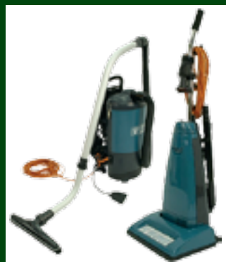
Truvox Back Pack/Truvox Teppebanker