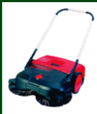
Haaga Turbo 770