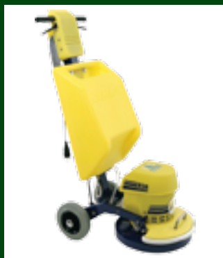
Cimex 3-børste CR-38